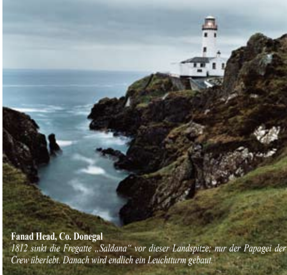
Fanad Head, Co. Donegal 1812 sinkt die Fregatte „Saldana“ vor dieser Landspitze; nur der Papagei der Crew überlebt. Danach wird endlich ein Leuchtturm gebaut.