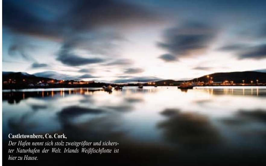
Castletownbere, Co. Cork, Der Hafen nennt sich stolz zweitgrößter und sicherster Naturhafen der Welt. Irlands Weißfischflotte ist hier zu Hause.

Connacht ist der wilde Westen Irlands, unwirtlich, einsam. Connemara macht den Eindruck, als hätte sich die Eiszeit gerade eben erst zurückgezogen, eine trübnasse Landschaft der tausend Seen und Tümpel; die Grafschaft Mayo, nördlich davon, scheint nur aus Klippen und Torfmooren zu bestehen. Als der Schriftsteller Heinrich Böll 1955 das erste Mal nach Achill Island reiste, wunderte er sich über eine „merkwürdige Gewohnheit“ der Iren: „Wenn der Name der Provinz Mayo genannt wird (sei es lobend, tadelnd oder unverbindlich), sobald nur das Wort Mayo fällt, fügen die Iren hinzu: God help us!“ Böll ließ sich nicht abschrecken, er kaufte sich drei Jahre später ein Haus